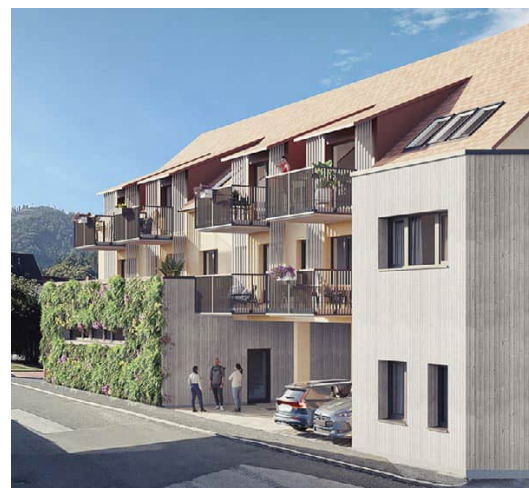
Teilansicht Gartengasse von Nordosten her

Die Beheizung erfolgt mittels umweltfreundlicher Fernwärme. Durch die strengen Auflagen im Rahmen der Wohnbauförderung entsteht in Deutschfeistritz ein nachhaltiges Projekt über Generationen hinweg – siehe dazu www.klimaaktiv.at .