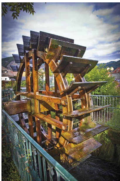
Deutschfeistritzer Wasserrad bei der Mühle im Ortszentrum

Dazu erfolgt der Abbruch bestehender Gebäude und in Folge die Errichtung von insgesamt 10 Wohnungen sowie in den Erdgeschoßbereichen gewerblich genutzten Flächen und zusätzlich 3 Kfz-Abstellplätzen.