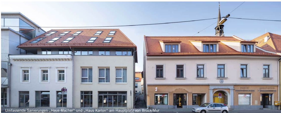
Kleine Auswahl der zuletzt realisierten Projekte der Unternehmensgruppe LEITNER.