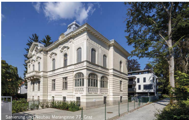
Sanierung und Neubau Merangasse 77, Graz