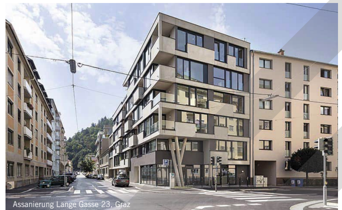
Assanierung Lange Gasse 23, Graz